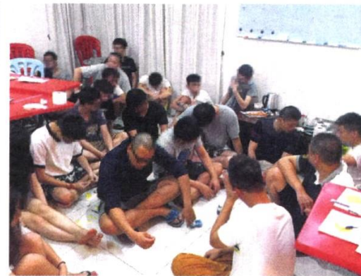
SINDIKET penipuan Macau Scam terus digempur oleh polis selepas memperdaya ramai orang dan mengaut keuntungan berjuta-juta ringgit. – Gambar hiasan

“Sindiket ini juga dipercayai mula merekrut orang Melayu dan ia menjadi antara faktor